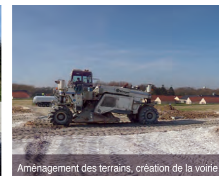
Aménagement des terrains, création de la voirie