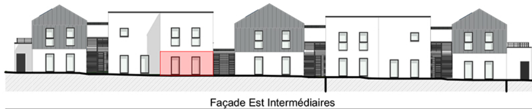
Façade Est Intermédiaires