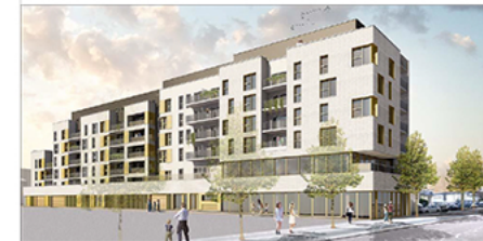
A 406 - R+4 - T3