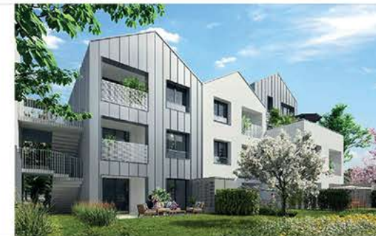
N°A01 - 3 pièces Bâtiment A, Rez-de-chaussée

Nota : ce plan est susceptible d'être légèrement modifié en fonctions des nécessités techniques de la réalisation en ce qui concerne les dimensions libres et l'équipement. Les retombées, soffites, canalisations et radiateurs ne sont pas figurés. Le mobilier représenté en pointillé est figuré à titre indicatif, non fourni.