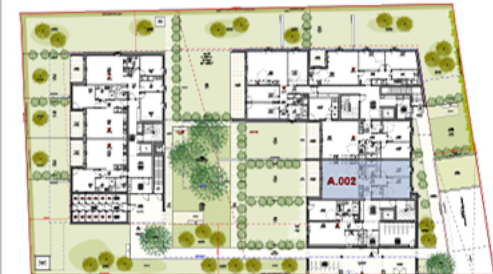
PLAN RDC - ECH : 1/750