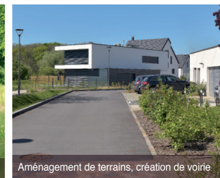
Aménagement de terrains, création de voirie