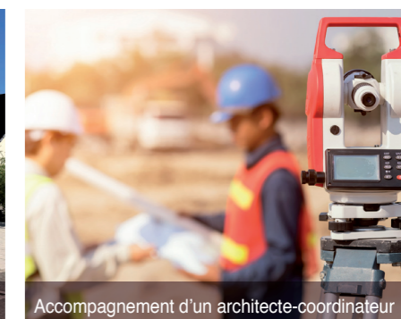
Accompagnement d'un architecte-coordonateur

Photos d'illustration, non contractuelles.