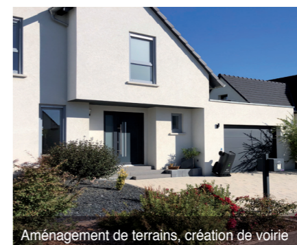
Aménagement de terrains, création de voirie