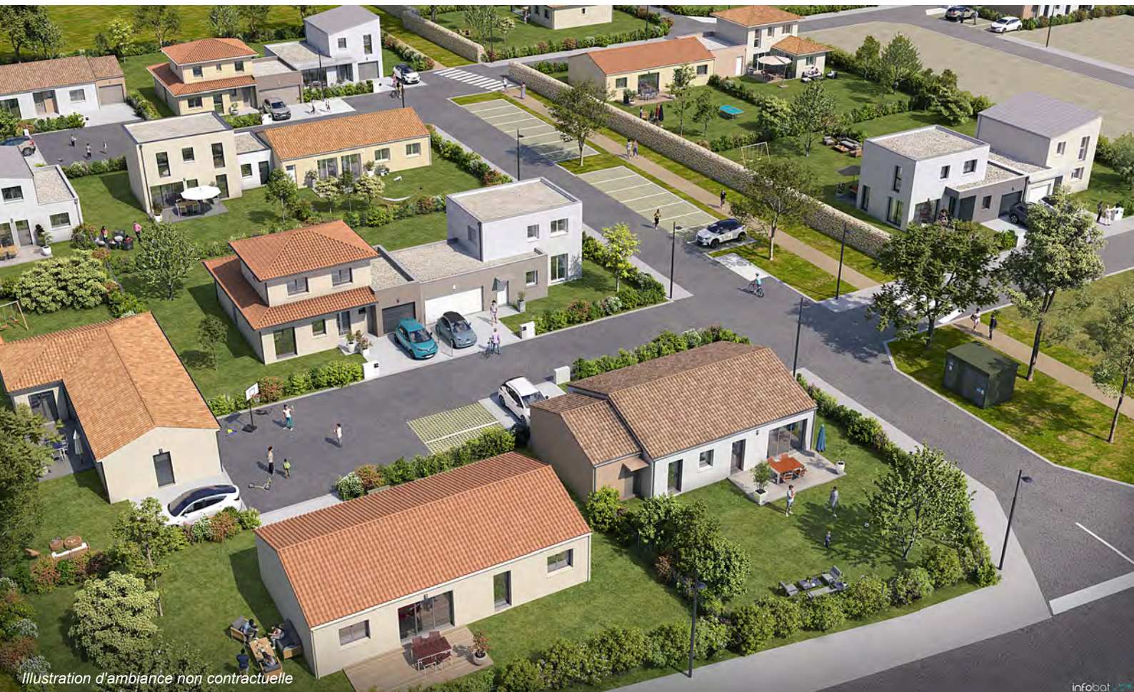
Illustration d'ambiance non contractuelle