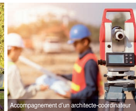
Accompagnement d'un architecte-coordonnateur