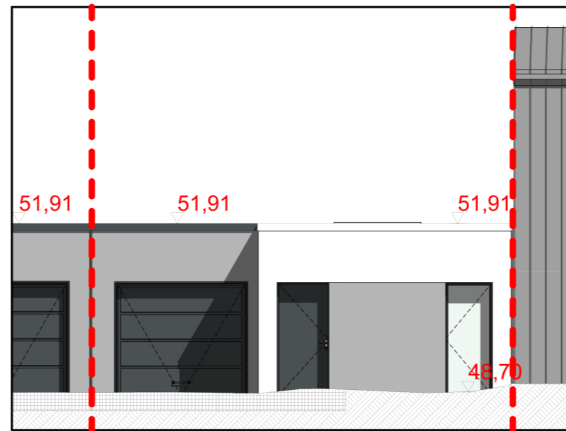
FACADE RUE 1/100ème