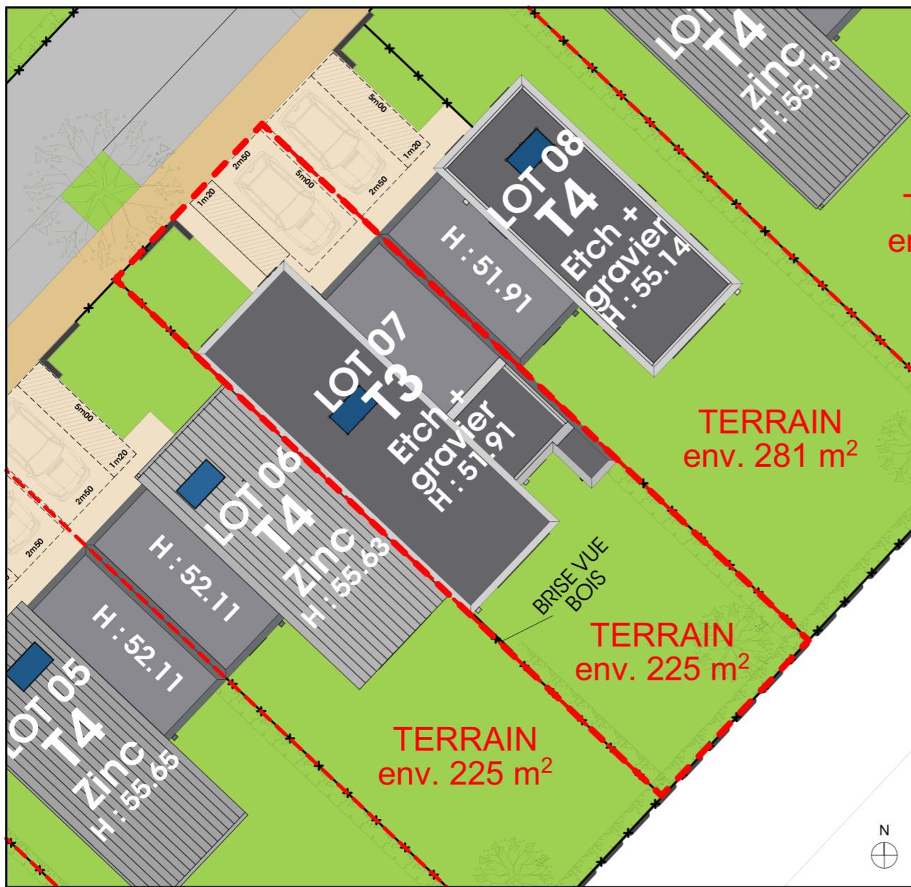
PLAN DE MASSE 1/200ème