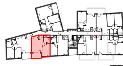
Tableau de Surfaces