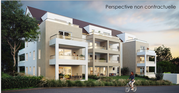
Perspective non contractuelle