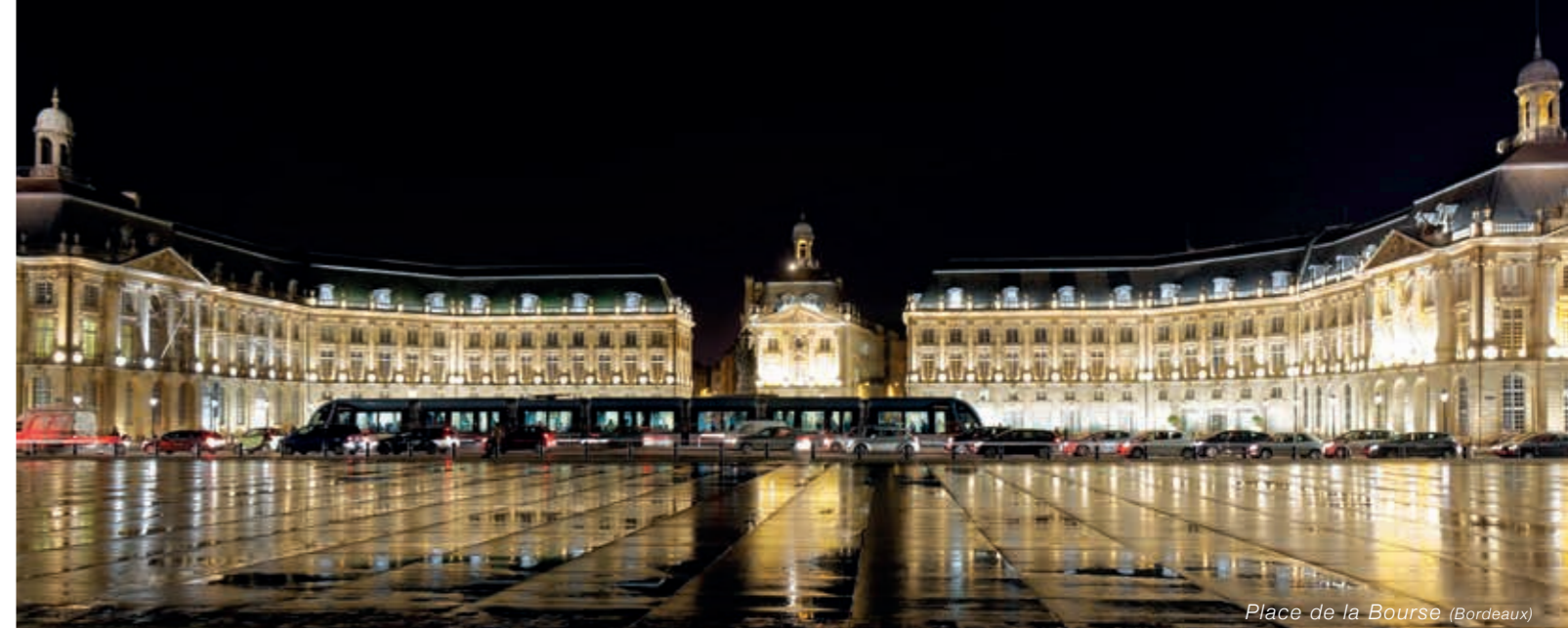
Place de la Bourse (Bordeaux)

A 3 minutes des centres-bourgs de Bassens et Carbon Blanc, «l'Orée des Vignes» possède de nombreux atouts pour séduire les familles. Au coeur du vignoble, idéalement situé entre châteaux et parcs de loisirs, vous pourrez profiter d'une région agréable et diversifiée à seulement 20mn du centre ville de Bordeaux. Les infrastructures socio-éducatives sont nombreuses et de grande qualité.