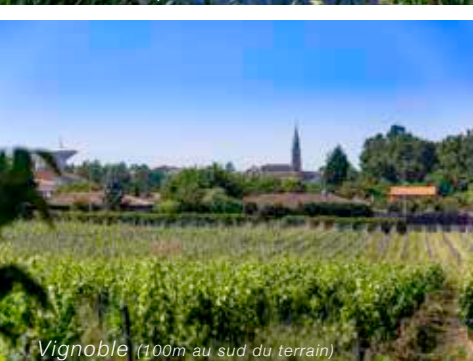
Vignoble (100m au sud du terrain)