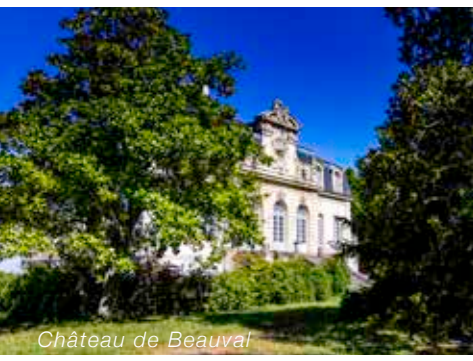
Château de Beauval