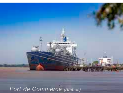
Port de Commerce (Ambarès)