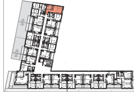
TABLEAU DES SURFACES HABITABLES