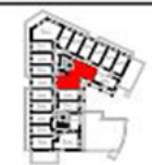
Tableau des surfaces (compris placards)