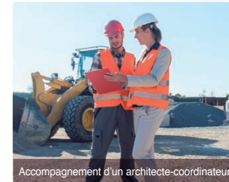
Accompagnement d'un architecte-coordonateur