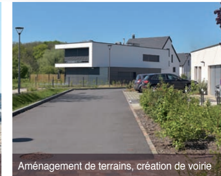
Aménagement de terrains, création de voirie