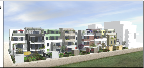
T2 - D102