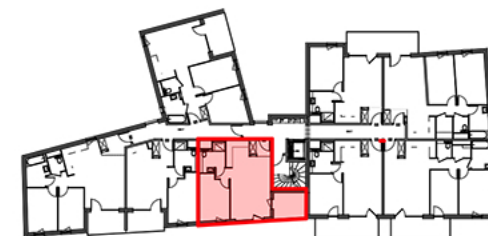
Tableau de Surfaces