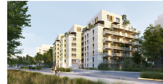
Bât J1 - Appartement J1-3.05-T2