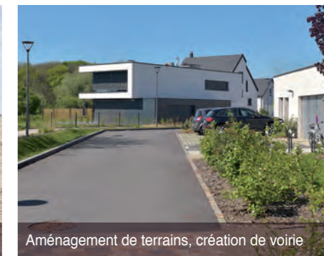
Aménagement de terrains, création de voirie