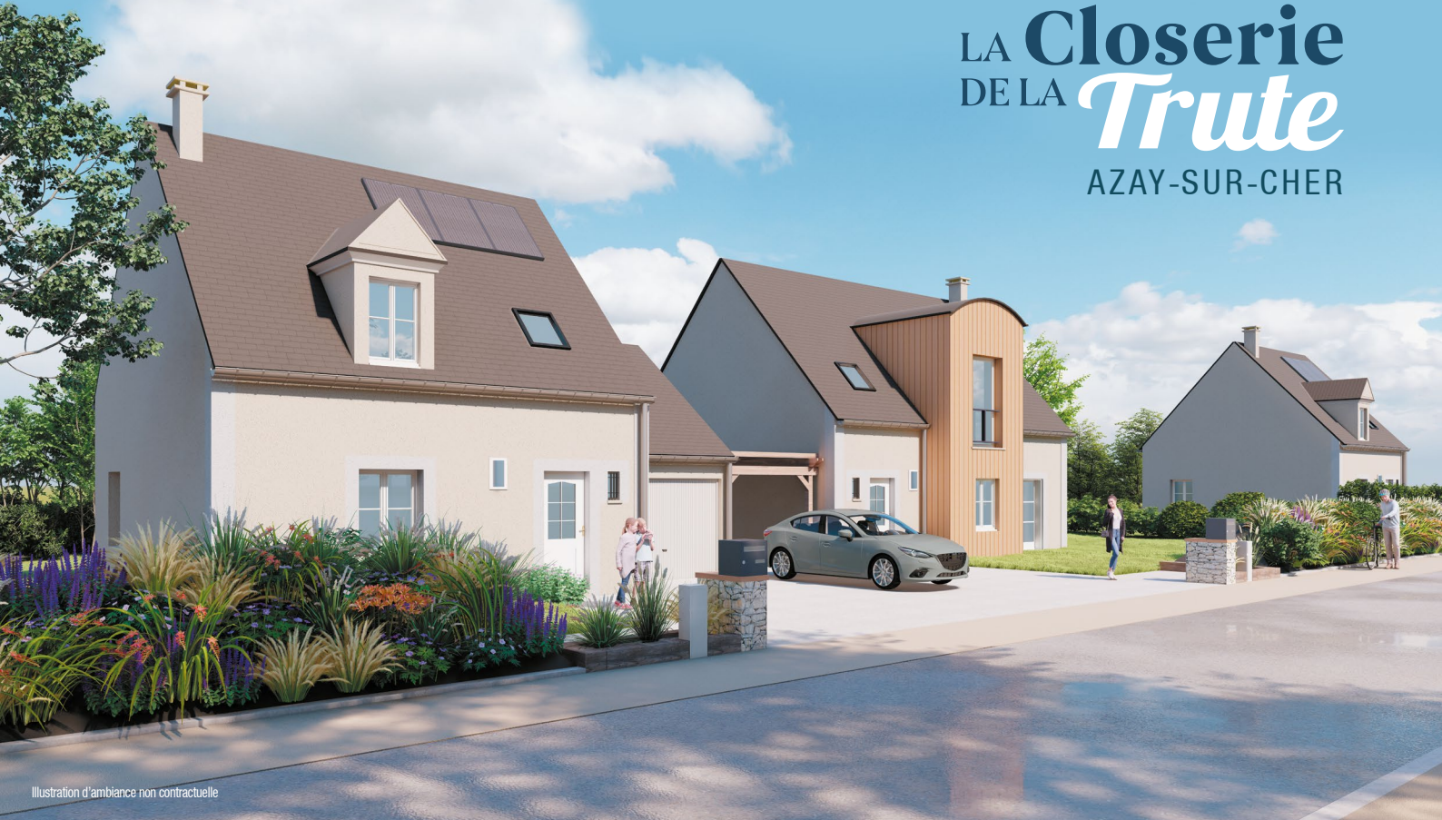
Illustration d'ambiance non contractuelle