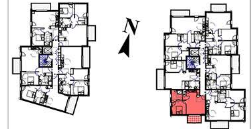
Bâtiment E-F Plan de réferage - S/E