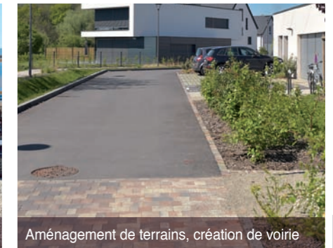
Aménagement de terrains, création de voirie