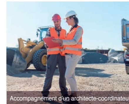
Accompagnement d'un architecte-coordonateur