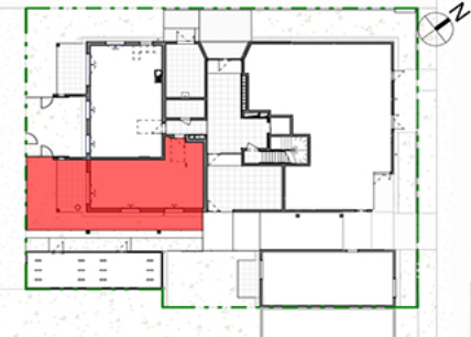
Plan de localisation / Cage B