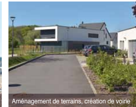
Aménagement de terrains, création de voirie