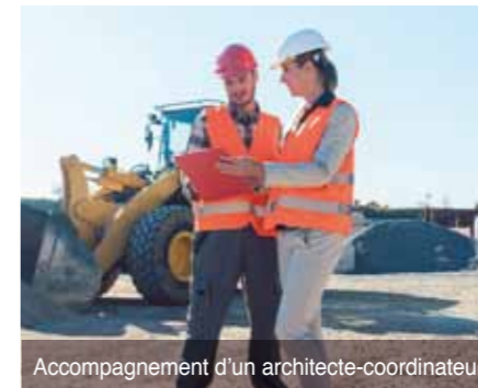
Accompagnement d'un architecte-coordonateur