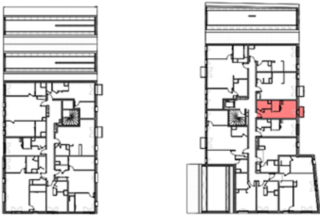
Plan de repérage appartement B-307