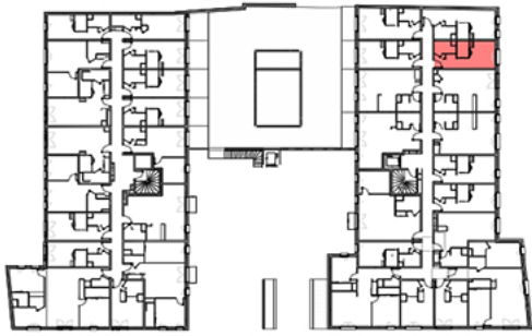
Plan de repérage appartement B-112