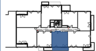
R+2 TYPE 2 n°B 204